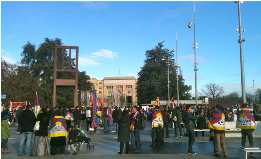
Giornata dei Diritti Umani – davanti all'ONU – Ginevra, 10 dicembre 2011

Grazie al nostro piccolo gruppo di fedeli collaboratori, per sostenere la popolazione tibetana abbiamo cercato di dare continuità alle attività ed agli impegni presi. Ringraziamo i nostri membri e gli amici per il loro sostegno attivo, finanziario o ideale. Speriamo di poter contare sulla loro collaborazione anche nel 2012, affinché sia possibile sviluppare ed incrementare l'impegno nei vari progetti umanitari e sostenere i tibetani sia in patria che in esilio, nel loro desiderio di poter un giorno ritrovare pace e felicità. Tashi deleg!